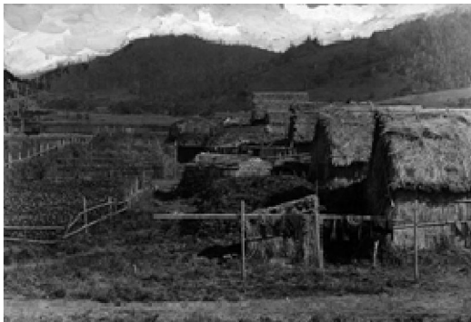
7 56*, none, USNM047477.00, pl. 8, LXXX