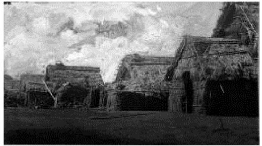
4 772*, 28821, USNM047475.00, pl. 5, LXXVII