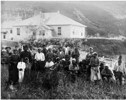
3 57, none, USNM052905.00, pl. 4, LXXVI