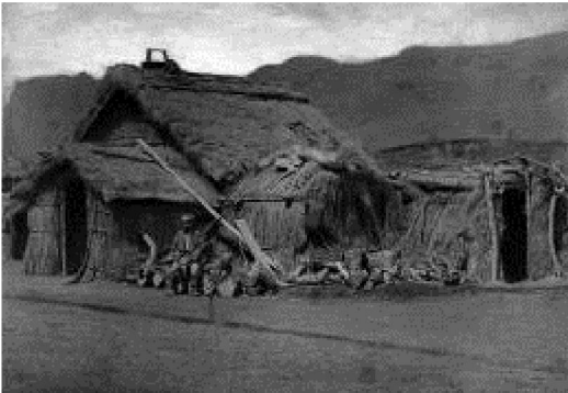
5 65*, none, USNM047476.00, pl. 6, LXXVIII