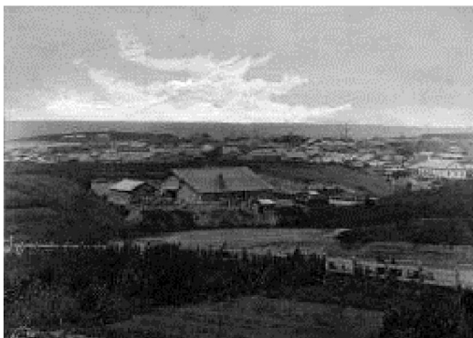
1 58, none, USNM047473.00, pl. 2, LXXIV