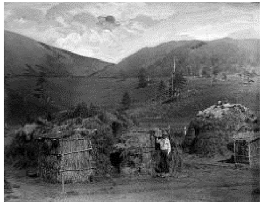
6 66, none, USNM052906.00, pl. 7, LXXIX