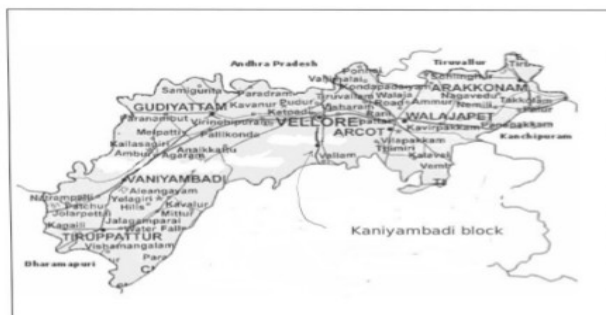
図1 ヴェールール郡

ヴェールール郡自治政府 (Collecrate) より入手した情報にもとづいている。*SC=Scheduled Castes, ST=Scheduled Tribes.